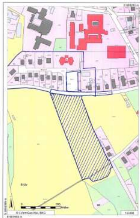
Berkenthin, Am Friedhof B-Plan Nr. 23