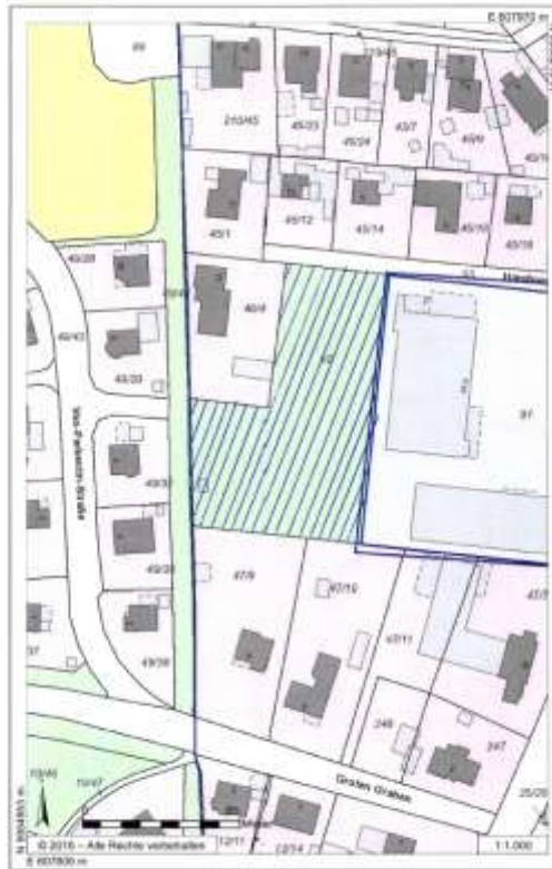
Berkenthin, hinter Penny B-Plan Nr. 21