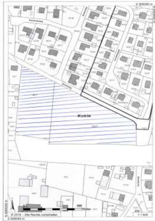
Berkenthin, Am Bahndamm B-Plan Nr. 22