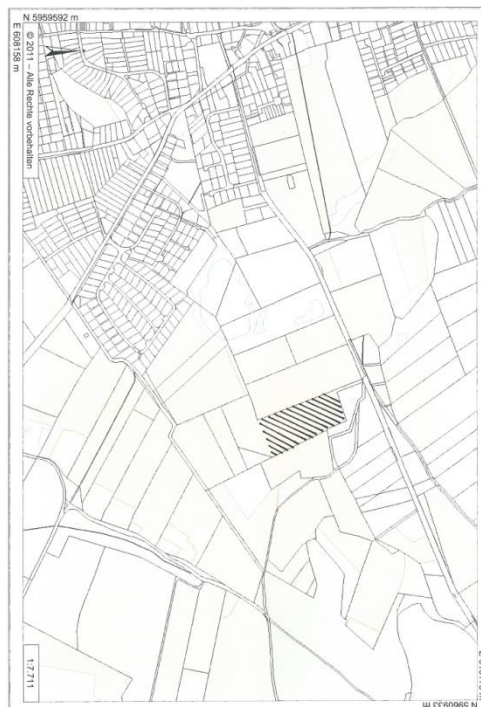
Krummesse, Beidendorfer Weg: