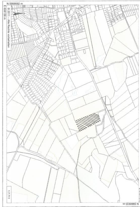
Krummesse, Beidendorfer Weg: